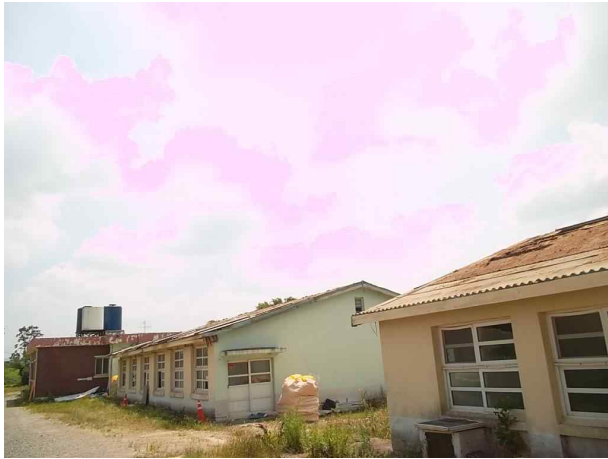
석면비산농도측정 대상 전경