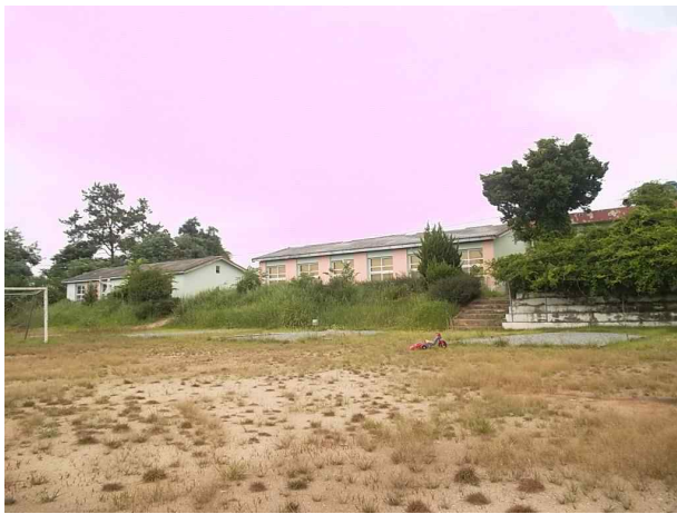
석면비산농도측정 대상 전경