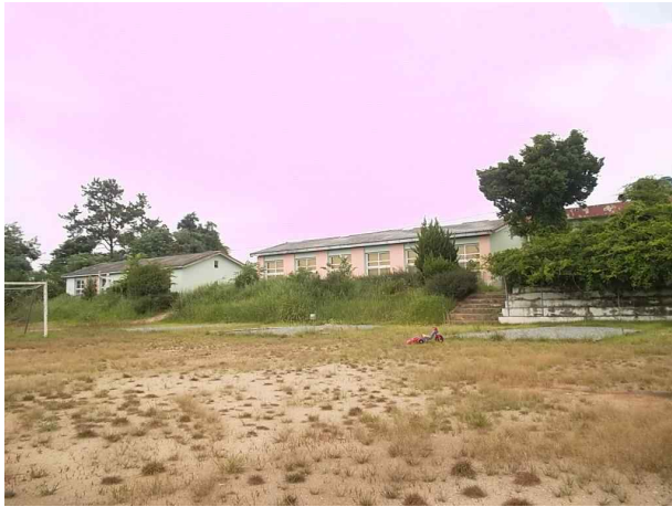
석면비산농도측정 대상 전경