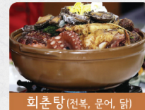
회춘탕 (전복, 문어, 닭)