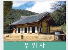
무 위 사