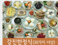
강진한정식 (30가지 이상)