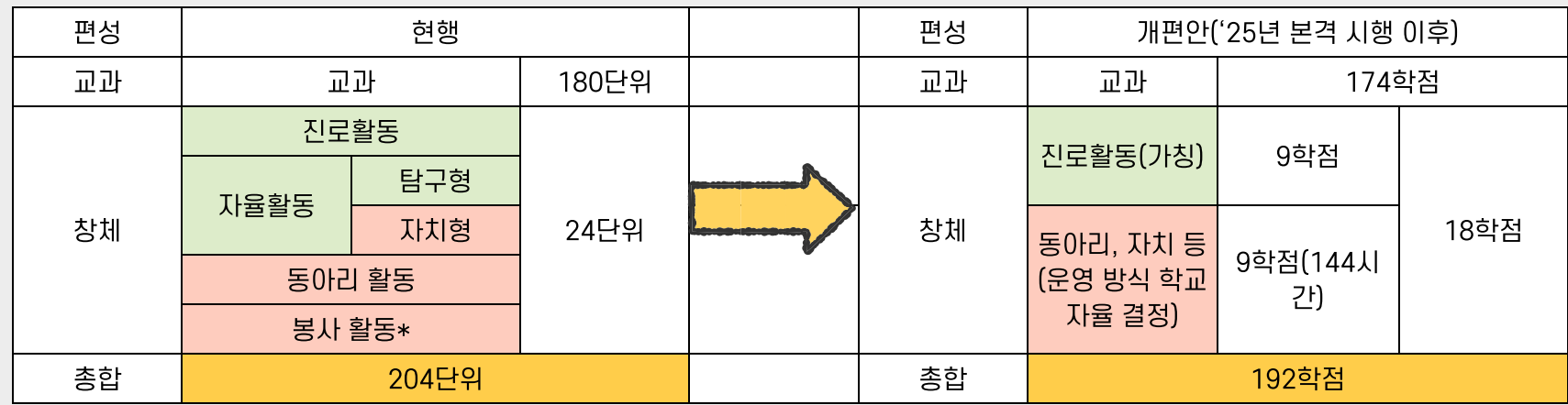
〈고교학점제 취득 방식〉